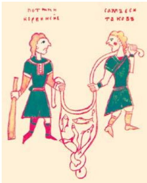
Буквица «М» из Фроловской Псалтири XIV века выполнена в виде двух рыбаков с неводом. Внутри даже можно разглядеть рыбок!