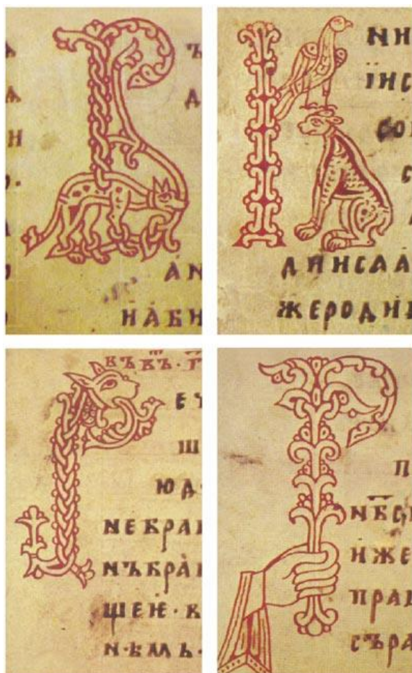
Буквицы из Юрьевского Евангелия